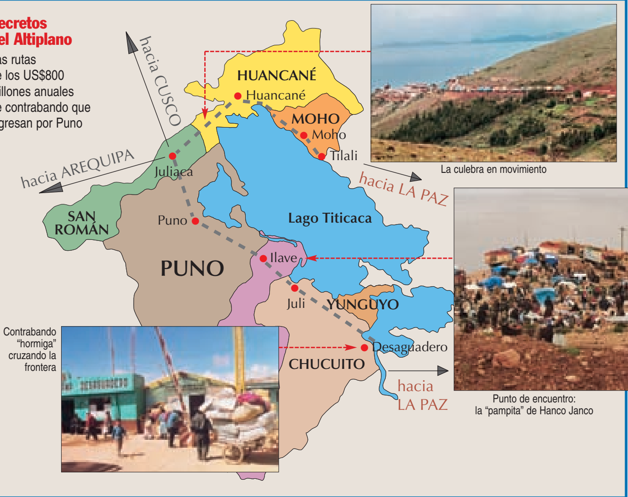
La culebra en movimiento

Las rutas de los US$800 millones anuales de contrabando que ingresan por Puno